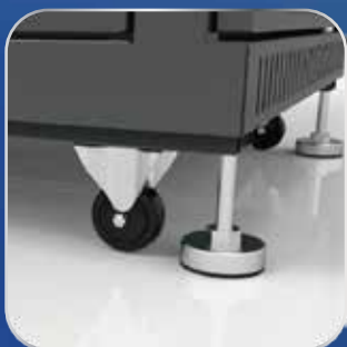
Ruedas y Regatones Regulables